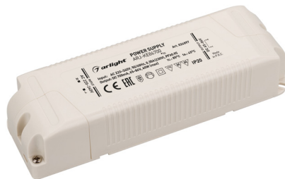
ARJ-KE70700 ARJ-KE86700 ARJ-KE481050 ARJ-KE571050 ARJ-KE301400 ARJ-KE361400 ARJ-KE421400A